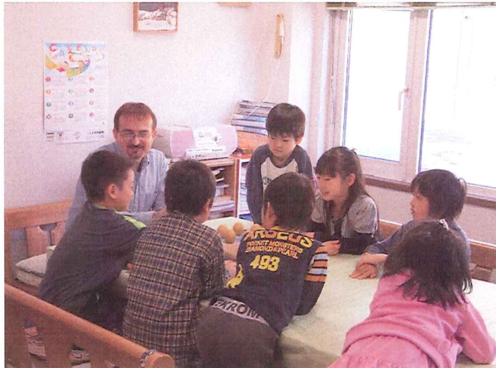
コグト先生と英語を学ぶ 昭和英語教室の生徒さん

火曜日の3時半から吉田新聞店2階、会議室で行っている『子供絵画教室』。写真や図鑑などを参考に、人や動植物の絵を描いている。デッサンの上達ばかりでなく、絵と向き合うことで、表現力の向上を目指している。