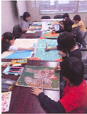
絵画教室の生徒さん

火曜日の3時半から吉田新聞店2階、会議室で行っている『子供絵画教室』。写真や図鑑などを参考に、人や動植物の絵を描いている。デッサンの上達ばかりでなく、絵と向き合うことで、表現力の向上を目指している。