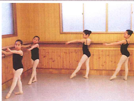
お姉ちゃんに負けじと頑張っています

ジュニア科、中学生から大人までのシニア科があり、現在小学生までで20名程度が毎週月・水曜日にレッスンを受ける。1年おきに釧路と中標津で発表会があり、一般の方にも披露をしている。