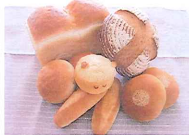
メロンパンはひつじだよ。