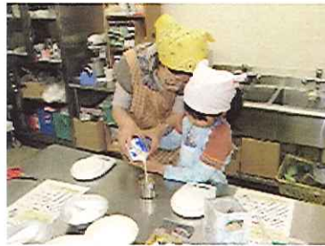
ポイント① 計量カップで牛乳、生クリームなどを量るよ。 (量るのにちょっと悪戦苦闘かな?)