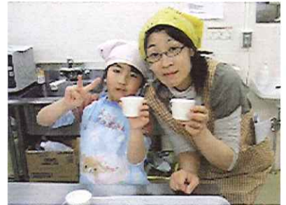
ポイント⑤ 容器に入れて完成!! (にっこり上手に出来ました)