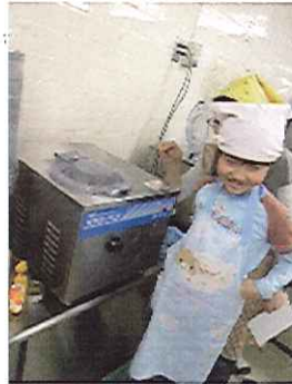
ポイント④ ミックスフリーザーに入れて 20分待つよ。 (これでアイスになるのかなあ～)