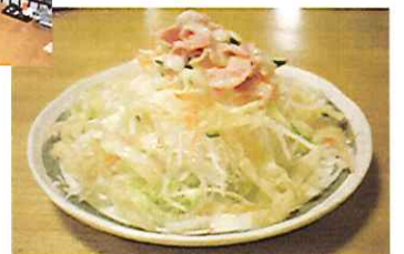
パリパリサラダ 420円

「よく出るよ」とオススメしてくれたのがコチラ。しゅうまいの皮を揚げたものをトッピング。不思議な食感がグセになりそう!