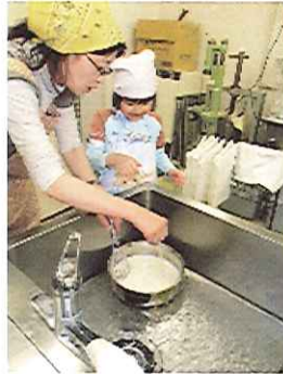
ポイント③ 氷のはったシンクで鍋を冷やすよ。 (40℃になったかな?)