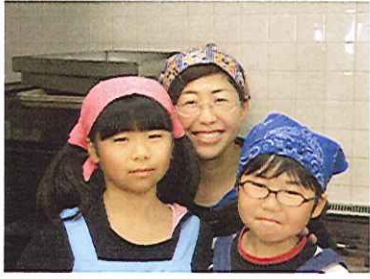
鳥取北の秋良さんファミリー