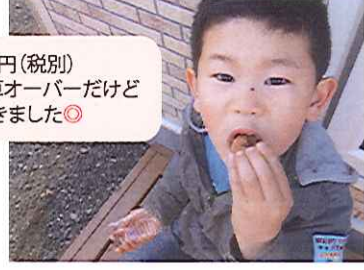
最後はおいしくいただきました♪