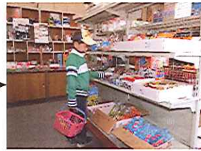
このお菓子なら何個買えるのかな~?