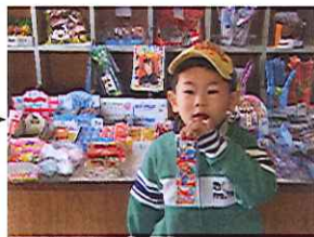
お母さんこれなら何個買えるの?