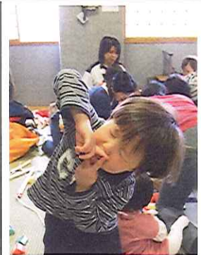
さまざまな育児に対する悩みなどをサークルを通じて相談しませんか?