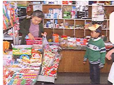
いくら買ったか計算中!足りるかな??