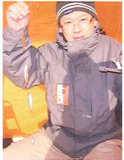
1度に3匹釣れました！！ スタッフもテントの中で大満足

その他、阿寒湖畔ではスノーモービルや水上スケートなども楽しむことが出来ます。 ひとつのテントの中で出来る家族団らん。是非とも阿寒湖畔のワカサギ釣りを楽しんでみてはいかがでしょうか？