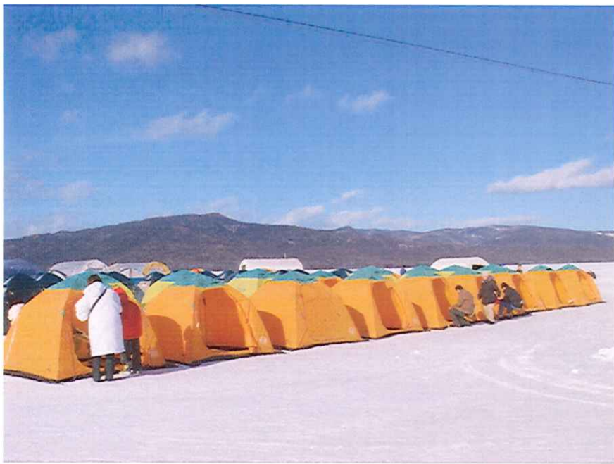
阿寒湖畔のワカサギ釣り (写真は昨シーズンの阿寒湖畔です)

いよいよシーズン到来。1月上旬から3月上旬まで、釧路近郊の湖で、気軽にワカサギ釣りを楽しむことが出来ます。北海道のワカサギ釣りは、近年脚光をあび、その魅力に惹かれ道外から観光でこられる方もいるほど。今回『たすき』では地元周辺はもちろん、北見方面からも大勢訪れるという人気の『阿寒湖畔ワカサギ釣り』をご紹介します。 家族で楽しむワカサギ釣り 阿寒湖畔でのワカサギ釣りは、釣り竿や餌等の用具は一切不要。必要なものは防寒着！すべてがレンタルで補え、さらに脚立なども貸し出していただける為、小さなお子様やご年配の方々にとっては、とてもありがたい。 ひとつの竿で一度に数匹も釣れることがあるので、多い日は数時間で、3桁釣ることも出来るほど。 当然のことながら、釣り上げたワカサギをその場でてんぷらにして食べられます。(お持ち帰りも可能) 北海道ならではの大自然料理を、その場で味わいたい。こんなところが、道外からの観光客に人気なのかも知れませんね。