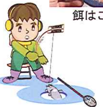
*テント内には穴が開けてある