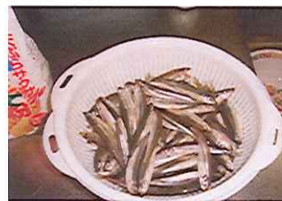
こんなに沢山釣れたよ！

阿寒湖畔観光協会 ■電話 (0154) 67-2254 あいすランド阿寒 ■電話 (0154) 67-2257