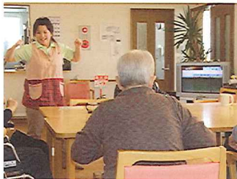
グループホームニチイのほほえみ釧路昭和 掛け声と共に身体を動かす入居者の皆さん

ニチイのほほえみ釧路昭和でホーム内の合言葉は『水分』『栄養』『排泄』『運動』の4項目。その中でも特に重要視しているのが『運動』であるが、冬期間は外出機会が少なくなることが原因で運動不足になりやすい。そのことからニチイのほほえみ釧路ではホームに合った、独自の運動プログラムをつくり、毎日の生活の中に習慣付けすることで、必要な運動量を補っている。その運動例として朝のリズム体操（ほほえみ体操）がある。午前9時半に始まるこの運動は、『元気に・ハツラツ・リズム（掛け声）に合わせて』をモットーに、全身を無理なく動かすことで身体の活発化をはかる。このような運動を1日3回、毎日同じ時間帯に行うことで体内リズムを整えている。その他にホームでは、食事前の口腔体操などもしています。