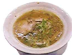
人気のとんとうラーメン

昨年12/12にオープンしたばかりのお店です。 釧路では珍しい“とんとう”（豚の背骨と頭骨で取ったスープ）は濃厚で、コクがあると早くも大人気！他にもスープに麺がよく絡むようにと、水分を少なくした自家製麺を使用。味・サービス・店内すべてにおいて、こだわりのお店！ 1度食べるとクセになりますよ。